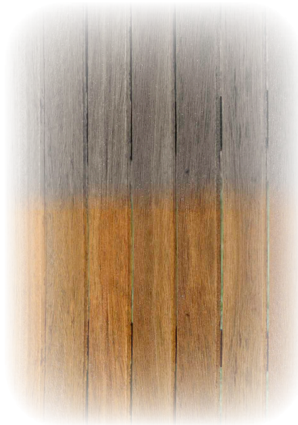
03/13 - RCS Tours 331 998 484

DURIEU S.A. - 91070 Bondoufle - France Tél. +33 (0)1 60 86 48 70 - Fax +33 (0)1 60 86 84 84